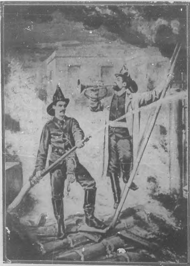
EL BOMBERO DEL COMERCIO (Dibujo de Landaluce.)