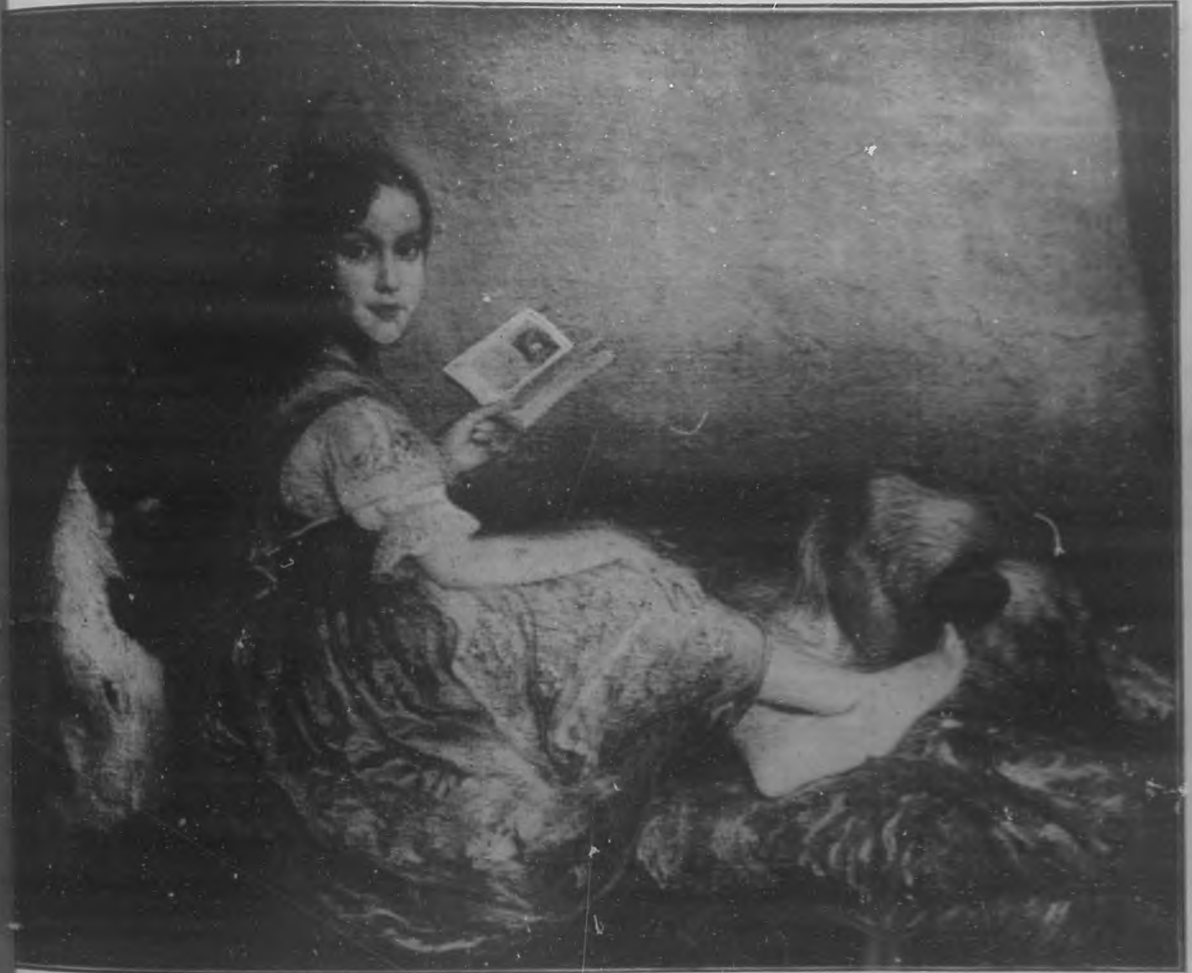
SONATINA Oleo por Pinazo Martínez.