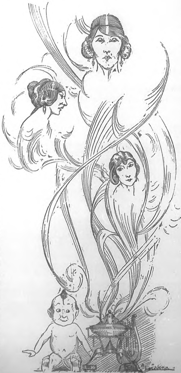
La mujer siempre ha sido la encarnación suprema de todo lo bello sobre la tierra.