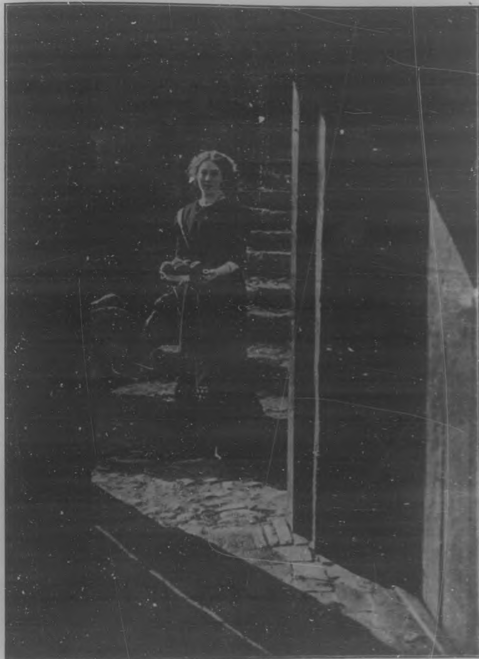
LA MERIENDA Cuadro de Aufnahme von Ernst Nielsen

LLEGOSE AL ARROYO. Y BAJO LOS NISPEROS, TENDIOSE EN EL SUELO. LA RODEARON TODOS LOS TIERNOS FLAMENCOS, CON SUS ALAS SUAVES Y SUS LARCOS CUELLOS. LUEGO POR SUS LABIOS AL ESPACIO ABIERTOS, CAIAN LOS NISPEROS JUGOSOS Y FRESCOS.