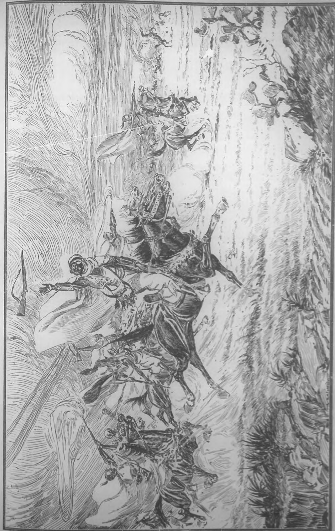
(Estudio para un cuadro por Abello Galindo)