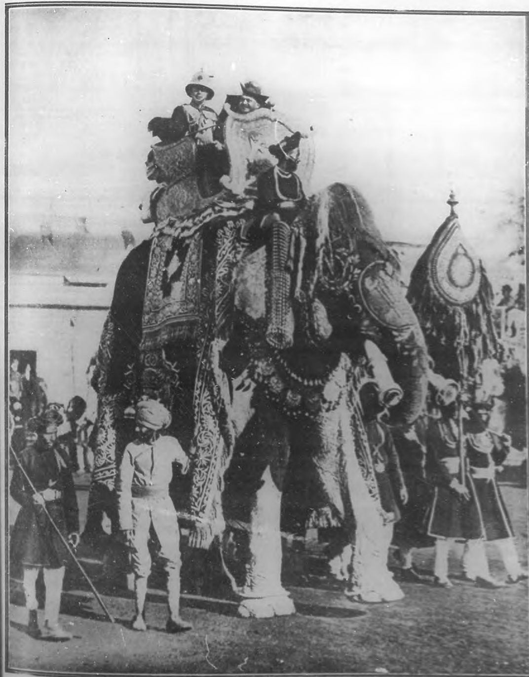
El Príncipe de Gales y el Maharajah de Gwalior, paseando en un elefante decorado con tapices de oro, momentos después de haber llegado el príncipe británico a los dominios del maharajah asediado.

Redacción, Administración y Talleres: Edificio de BOHEMIA, Trocadero número 89, 91 y 93. Teléfonos: Dirección: 2169; Administración: 2168; Redacción: 2168.